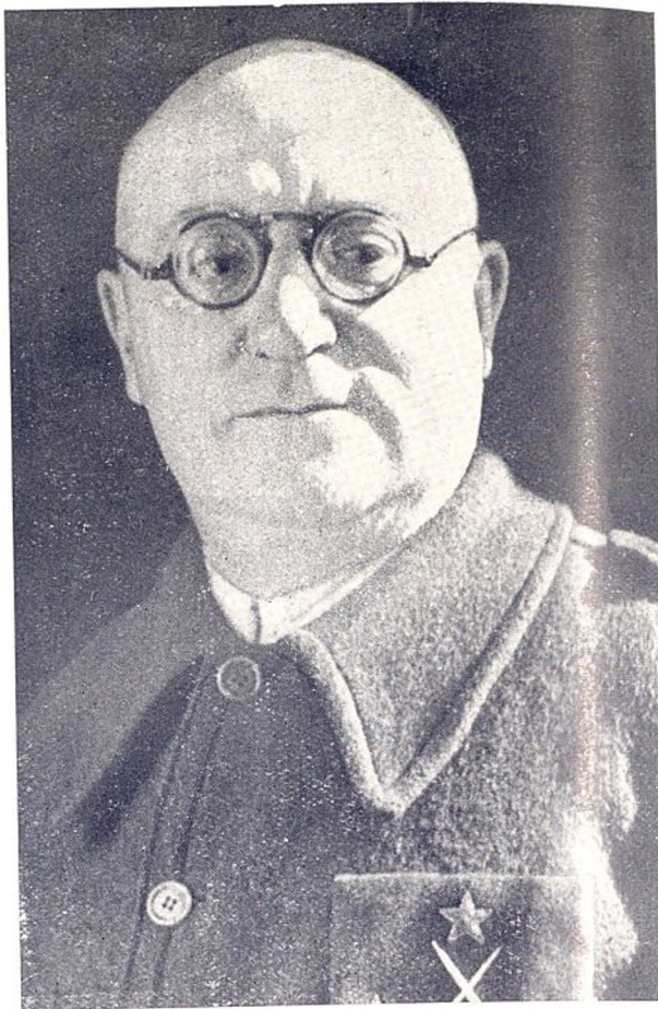
El glorioso general Miaja Jefe de la defensa de Madrid

lar Popular, industrias de guerra, organismos imprescindibles para ganar nuestra lucha y hoy el Ejército del Centro es el orgullo del Ejército Español, por su combatividad, organización, y alto nivel político popular.