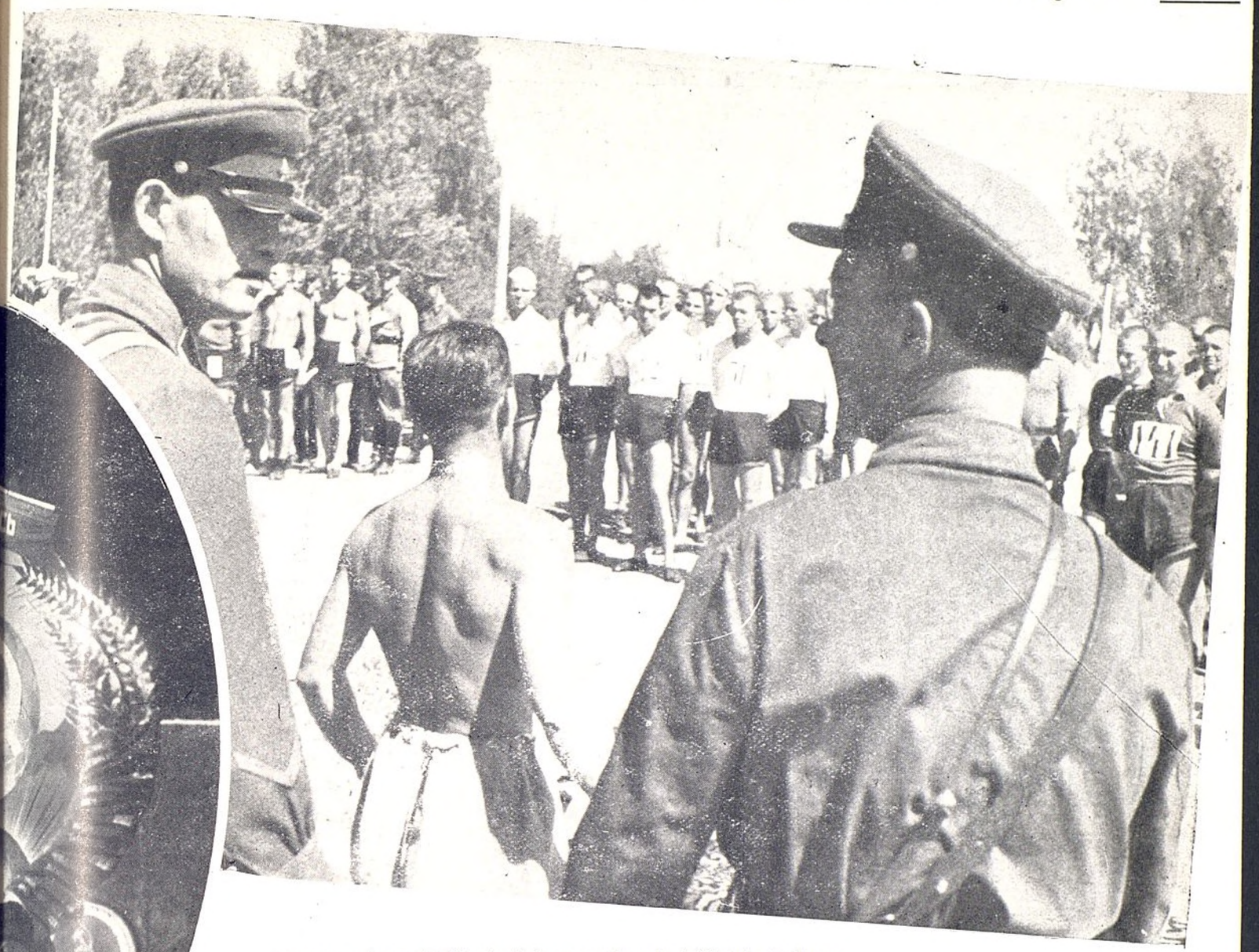
Futuros tenientes del Ejército Rojo en una Escuela de Oficiales de Moscú