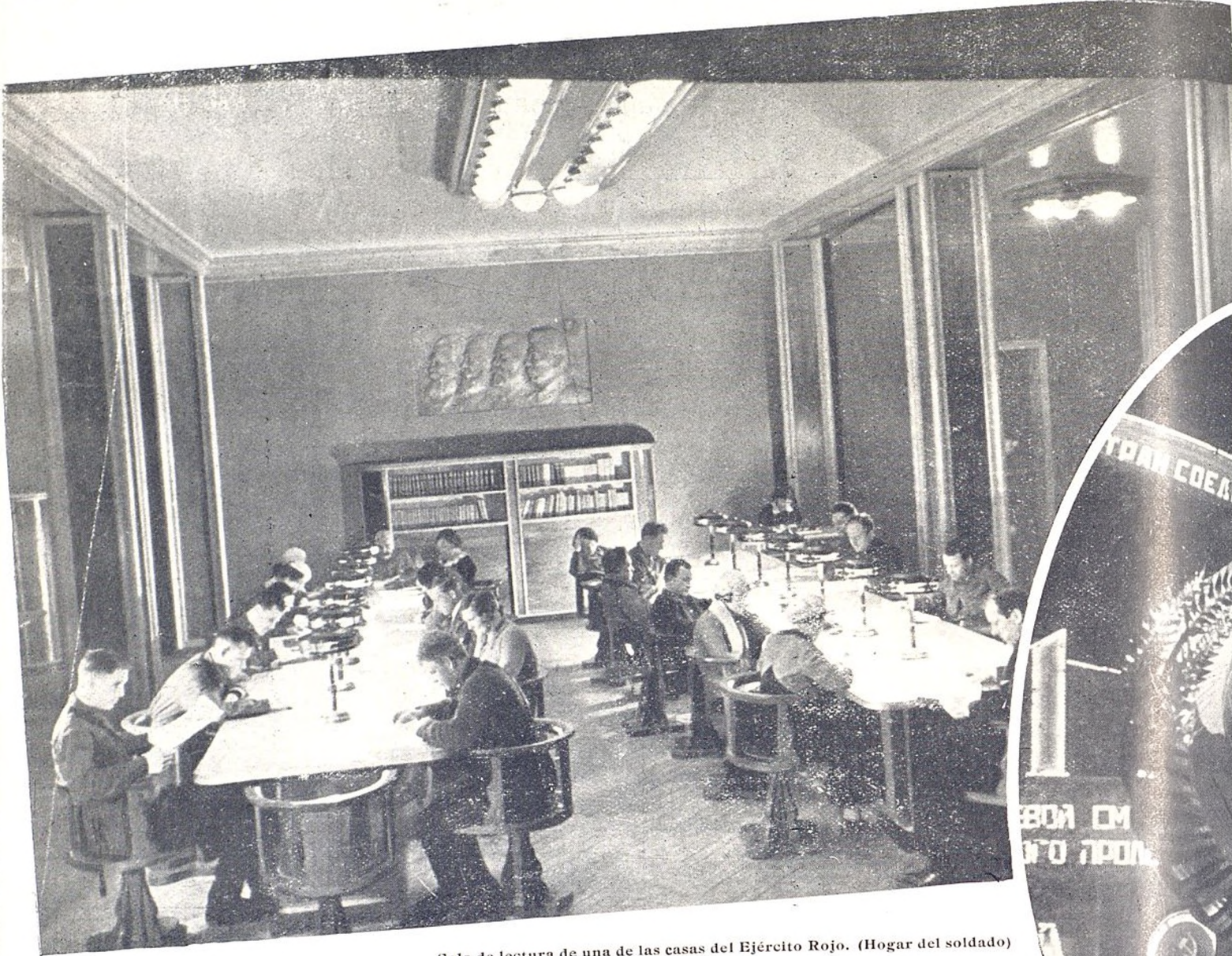
Sala de lectura de una de las casas del Ejército Rojo. (Hogar del soldado)