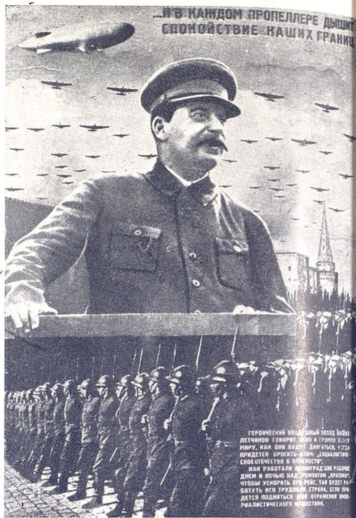
Stalin máximo dirigente de la U. R. S. S.

la U. R. S. S. es el auge, el florecimiento, la regeneración de las masas del pueblo, en una palabra: la paz, la libertad y la cultura.