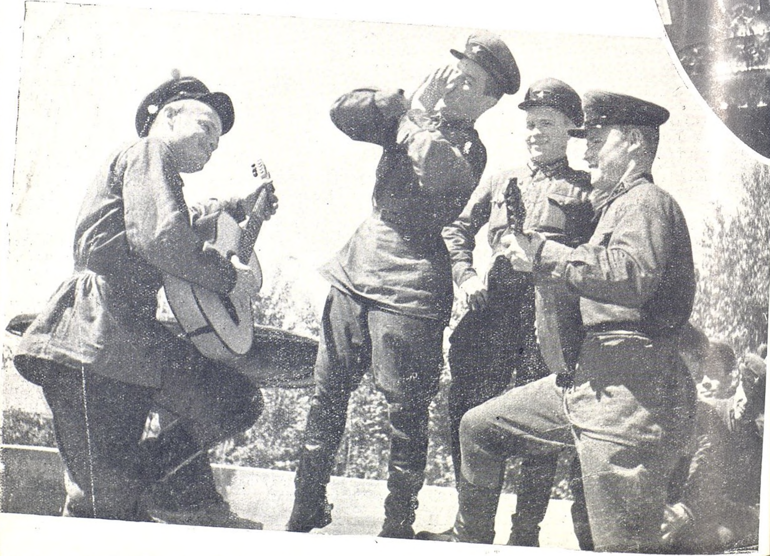
En la Escuela de Oficiales «Kamenev» en Kiev, capital de la Ucrania Soviética. Una cometa de la gran aviación soviética en pleno vuelo.