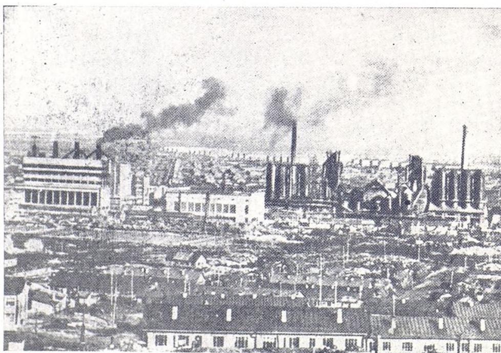
El gigante metalúrgico Kusnetz (Siberia)

Hoy se realiza en la práctica las palabras proféticas de Marx, Lenin y Stalin. El triunfo del socialismo en la U. R. S. S. es un triunfo de importancia mundial. Todavía no ha conducido al derrocamiento de los regímenes autoritarios. Pero el potente movimiento hacia el socialismo y el Frente Popular en todos los países capitalistas, adquiere y seguirá adquiriendo cada vez mayor amplitud, cuanto más profundo sea el contraste entre el florecimiento del país soviético con su democracia proletaria desarrollada, y el mundo capitalista, fascista que camina a la ruina, con los tormentos de un terror fascista, los guardias blancos. La humanidad ha llegado a un límite histórico en que ninguna reacción por mucho que arrecie, puede detener el viraje de las masas del pueblo hacia la U. R. S. S., este gran viraje operado en la conciencia de las masas del mundo entero aún no se ha desarrollado, por una cantidad de factores, (política de claudicaciones de la dirección de las masas obreras ante las provocaciones fascistas, etc., etc.). A las masas les habían dicho que el país de los soviets era la degeneración general. Sobre la experiencia de la vida ven que hoy