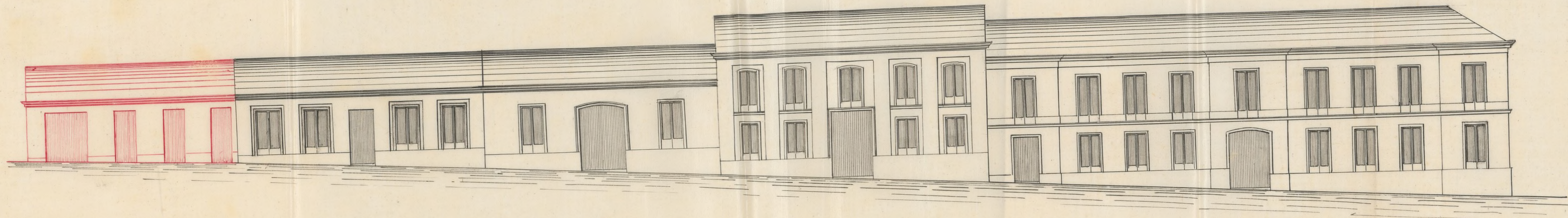
Fachada de la Casa Calle de Sarcilaso n.º 2. manz.º 16, en el Barrio de Chamberí.

Escala de 100 90 80 70 60 50 40 30 20 10 0 5 10 pies castell.