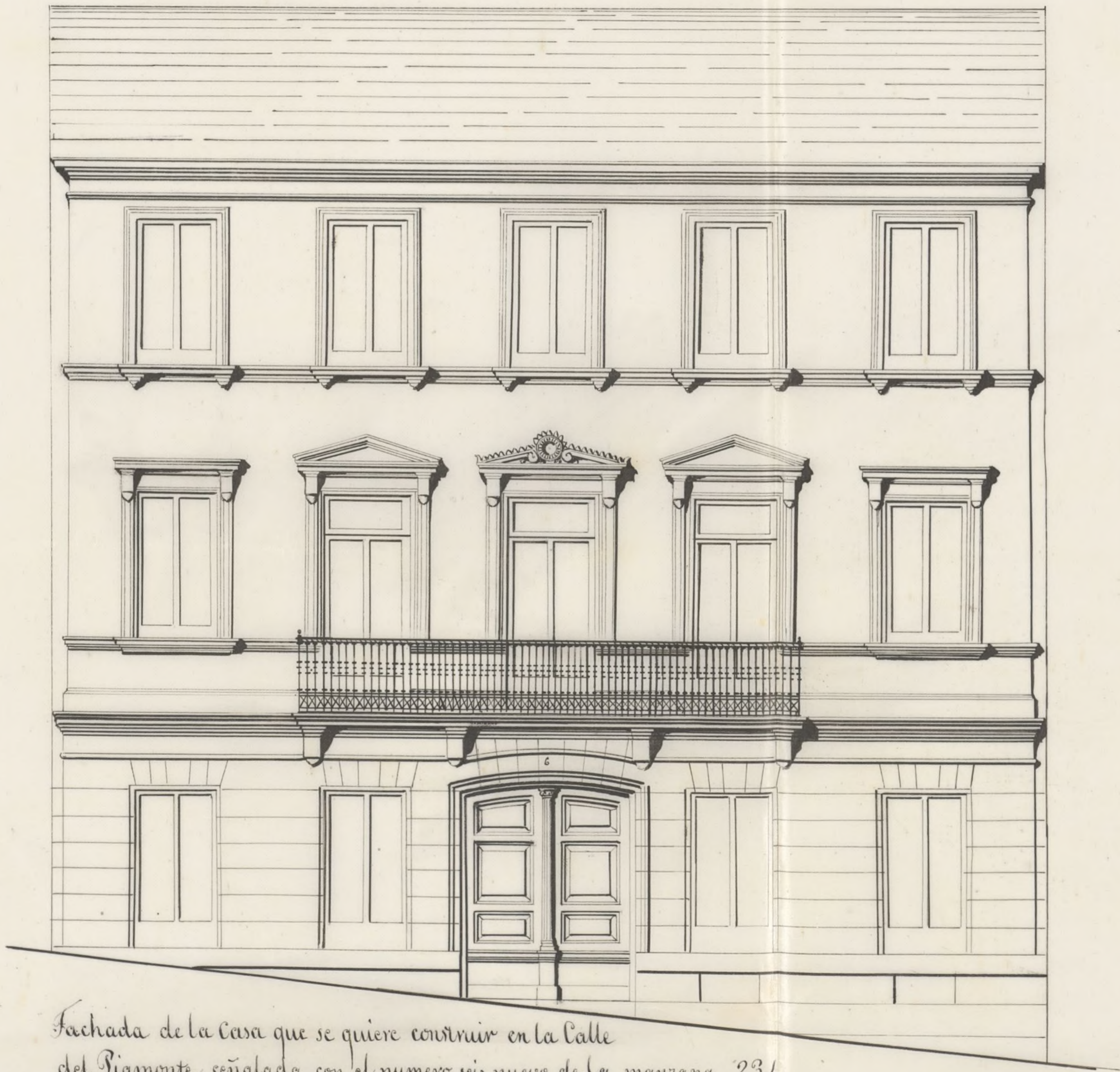
Fachada de la Casa que se quiere construir en la Calle del Piamonte, señalada con el numero seis nuevo, de la manzana 234.