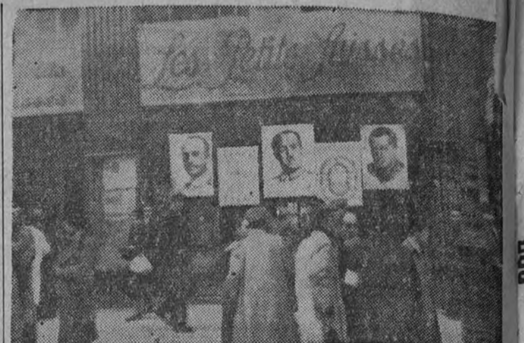
Retratos del Caudillo y de José Antonio señorean ya las fachadas madrileñas.

BERLIN 31.—"La Correspondencia Política y Diplomática", comentando la moción de simpatía dirigida a los checos votada por la Cámara francesa, declara que este rasgo no podrá menos de suscitar una impresión desagradable en los checos, los cuales no han olvidado que Francia, después de haberlos explotado como elementos de su política antialemana, en el momento decisivo los dejó abandonados a su destino. Después de haber afirmado que la iniciativa de la Cámara francesa constituye una injerencia en cuestiones que no la incumben. "La Correspondencia" concluye que tales nociones no tienen valor alguno. (Efe.)