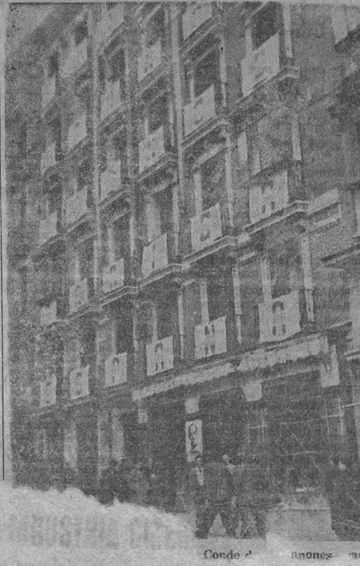
Conde de... anones...

Art. 8.º En sonal que por tancias no ha- res, pero se es- integrarse al t- incursos en lo q- anterior artícu- solo un artícu-