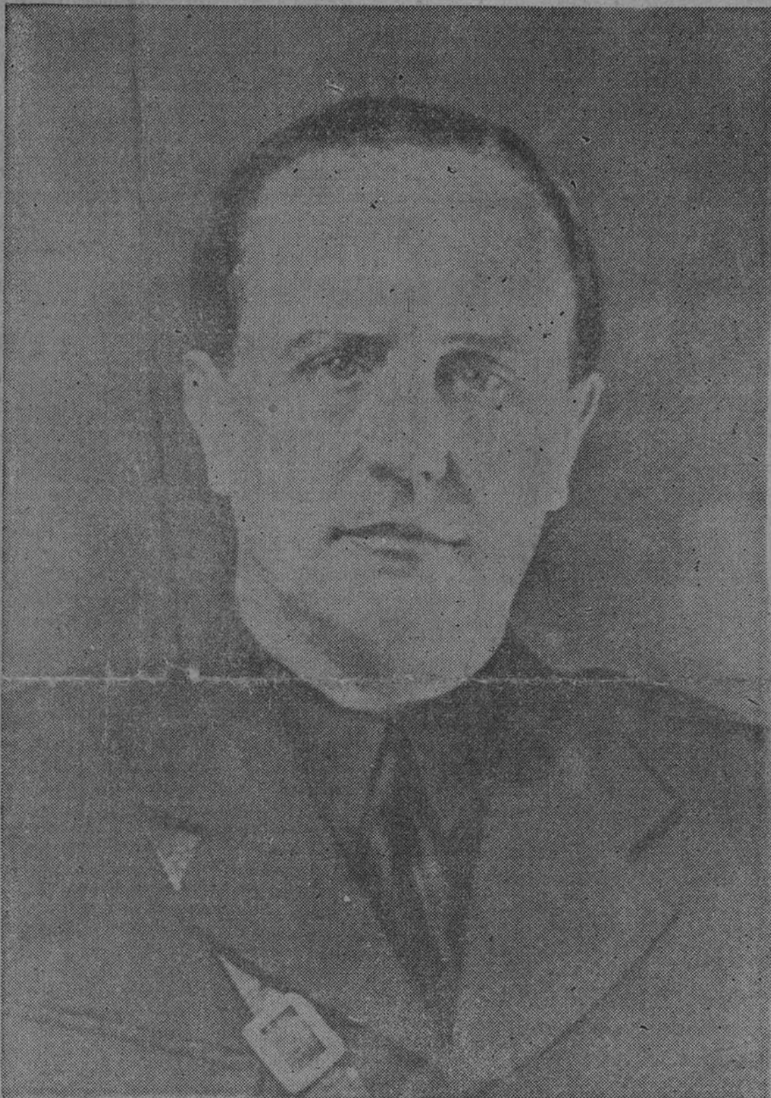
El camarada Raimundo Fernández Cuesta, ministro de Agricultura y secretario general del Movimiento, que acaba de regresar de Italia, al frente de una Misión extraordinaria

Un gran navio ot ha llegado a las tripulaciones deberán ocupar antigua flota conductores u