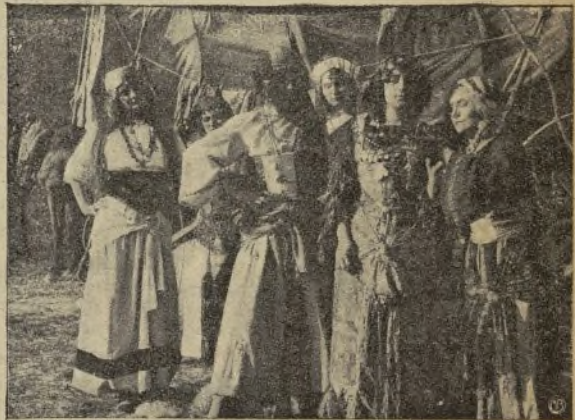
Una escena de la película «El amuleto»

Pero, uno de los agentes, no tarda mucho en ir á recordarle su compromiso; ella rehúsa á servirle porque ama á su marido; el agente la