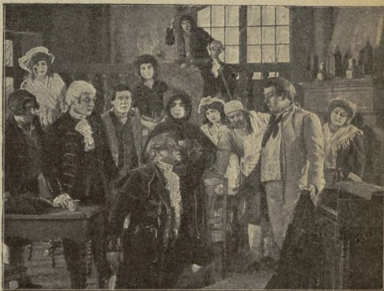
Una escena de la película «Gagliostro»

Ya nadie se acordaba de los religiosos, que taciturnos se calentaban junto al hogar, cuando