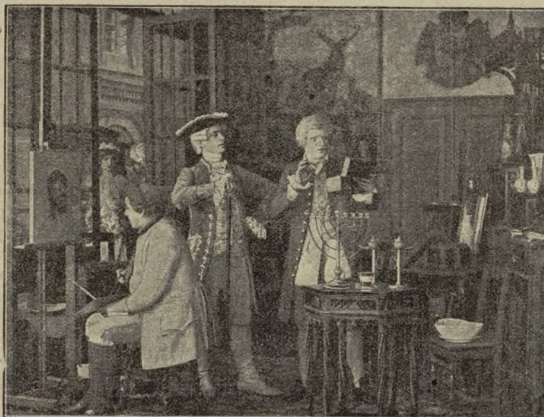
Una escena de la película «Cagliostro»

Su renombre traspasó las murallas y se ex-