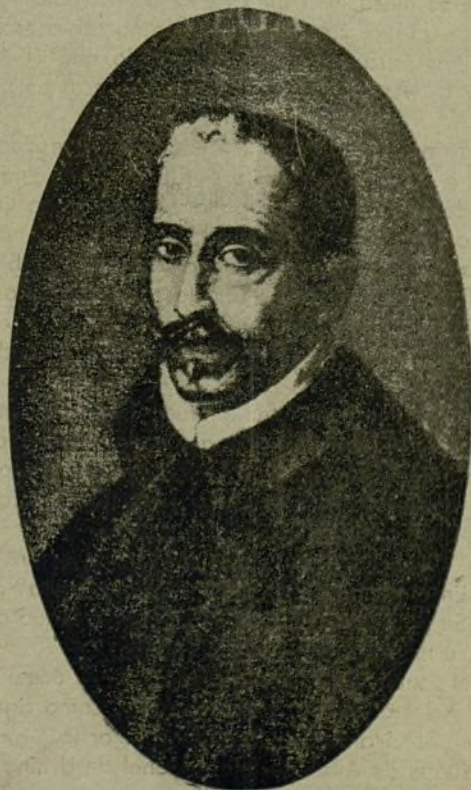
Lope de Vega Carpio