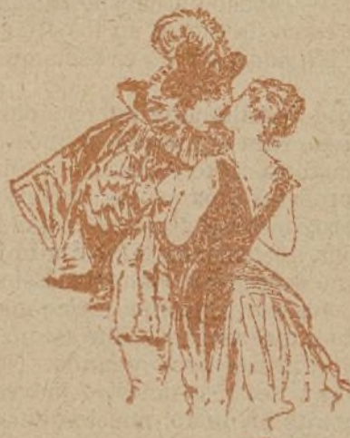
EN EL BAILE DE MÁSCARAS

—Yo te quiero, Salud, aunque me inquietas. —¿Usted quiere... salud? Pues yo... pesetas.