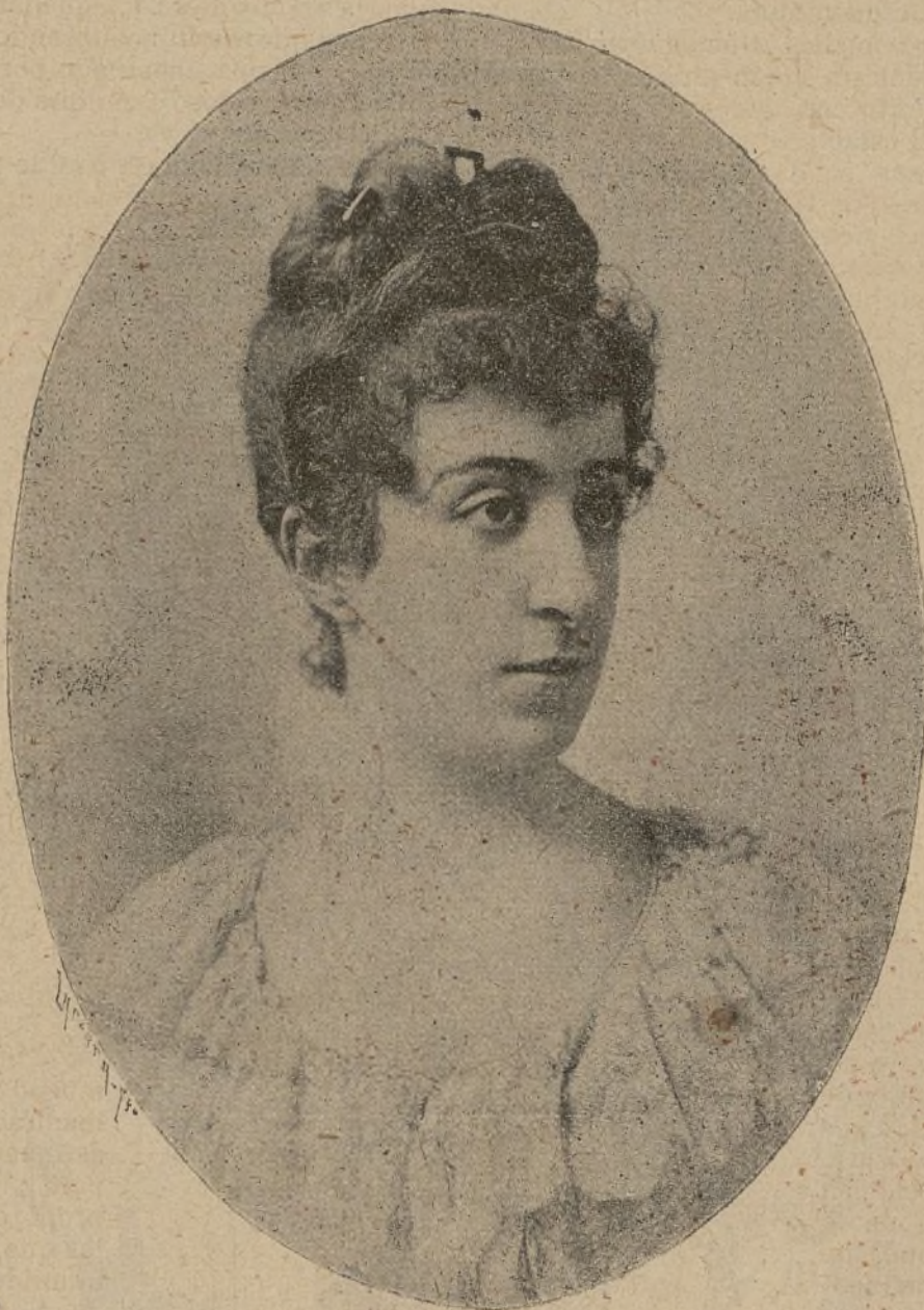
Prima donna del Teatro Real.

Como la chica supo tener destreza, y el muchacho era tonto de la cabeza, se celebró la boda de Pepe y Juana en San Luis, un domingo por la mañana. Nada turbó la dicha del matrimonio los dos primeros meses; pero el demonio, que si no hace diabluras no está contento, fastidió á los muchachos en un momento, haciendo que Juanilla forzosamente, pensara á todas horas en su teniente.