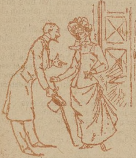
SALUD Y PESETAS

Pero yo no había metido aún mi cuarto á ganaderos—porque lo que es «á es-