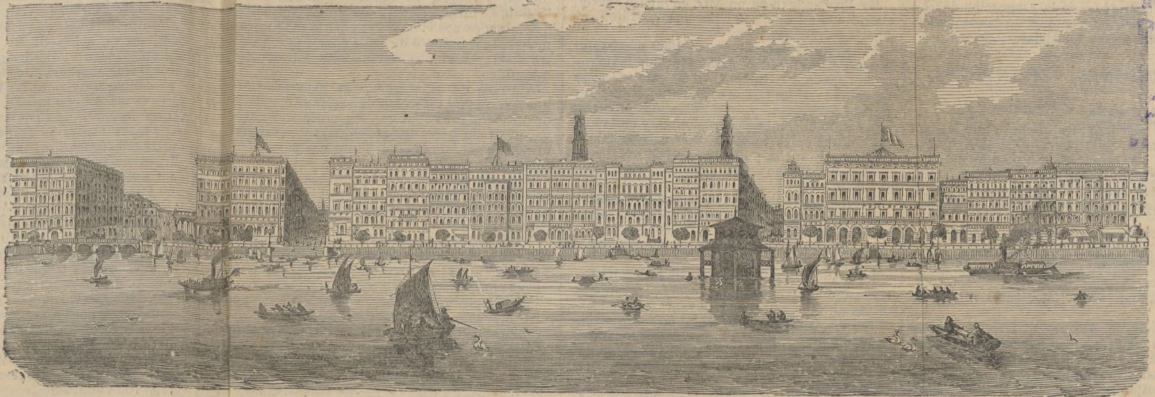
Vista general del puerto y de la ciudad de Hamburgo.