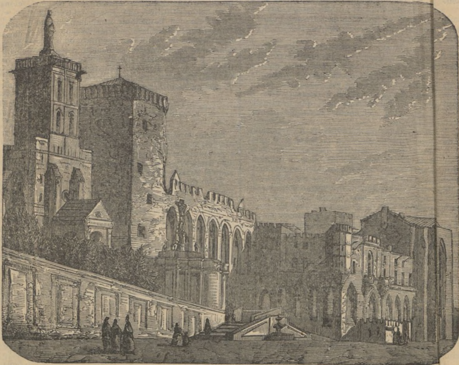
Palacio del arzobispo en Narbona.

Culebrones.—No ha habido operaciones. Las mamás temen los efectos de este artículo.