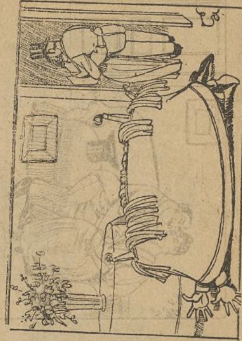
Y en tanto el pagano grita. se larga con Elisita.