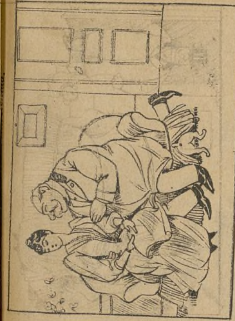
Y á Pepe en las pantorrillas i rincipia á hacerle cosquillas,