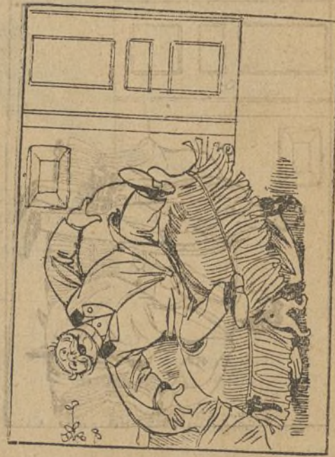
Hasta que dice: ¡agua vá! y echa á rodar el sofá.