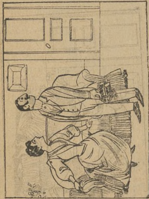
A su amante Pepe Pisa recibe la bella elisa.