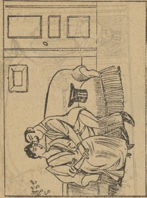
Y se encuentran sorprendidos al sentir unos ladridos.