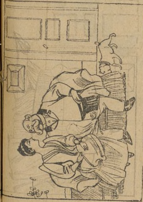
Y comienza el hombre á anar y el perro en pieza á buen car.