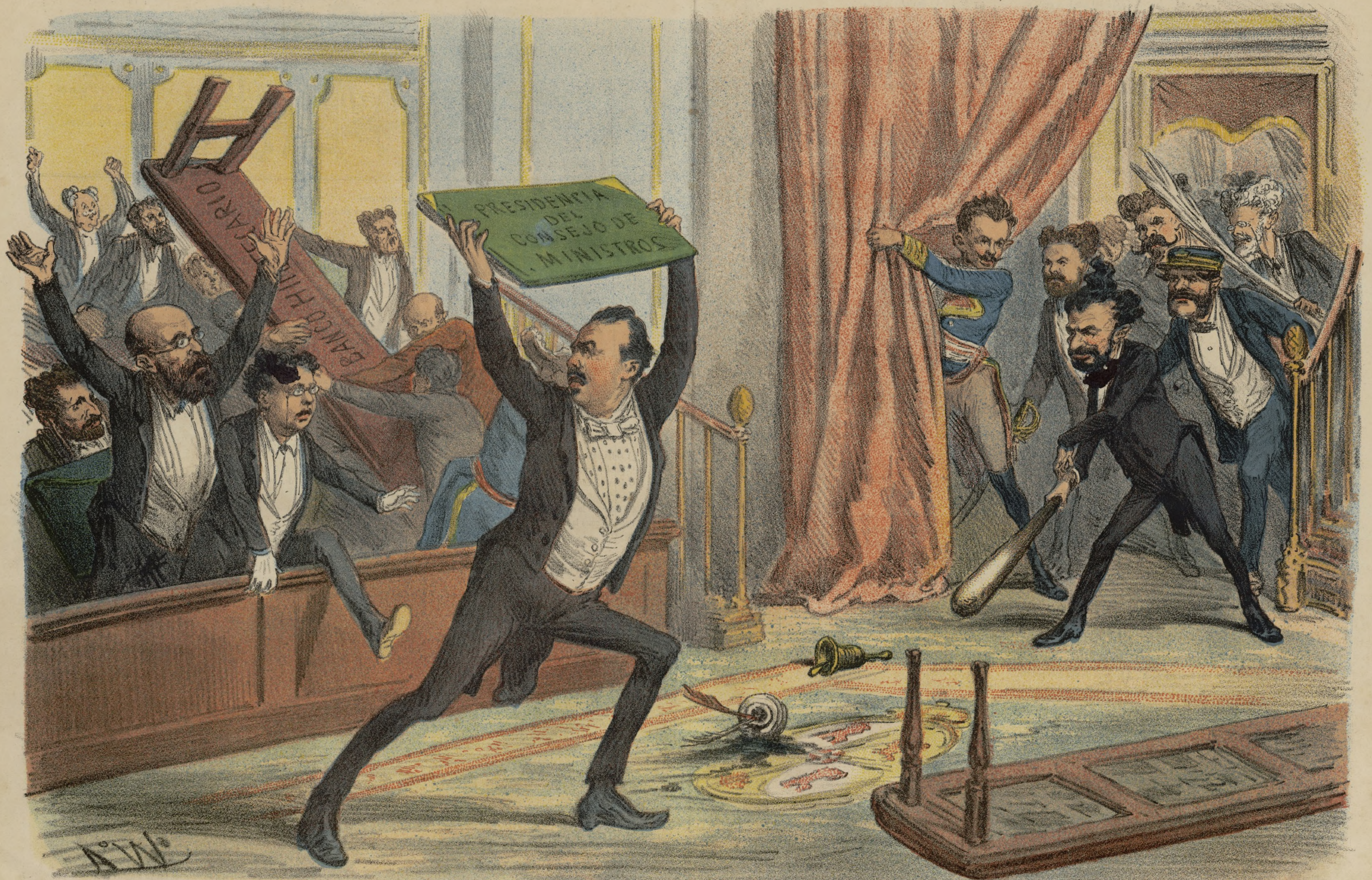
Ayuntamiento Radicales a defenderse