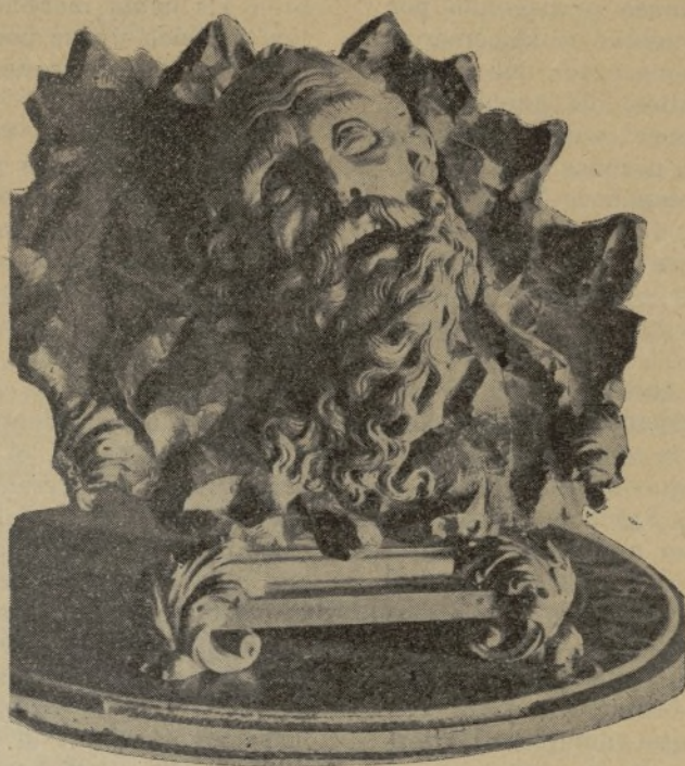
Cabeza de San Pablo

sionado por Cristo de San Pablo y el proselitismo urgente y metódico de los Varones Apostólicos. Este sello, con los caracteres que acabo de apuntar, se manifiesta hoy pujante en la lucha que