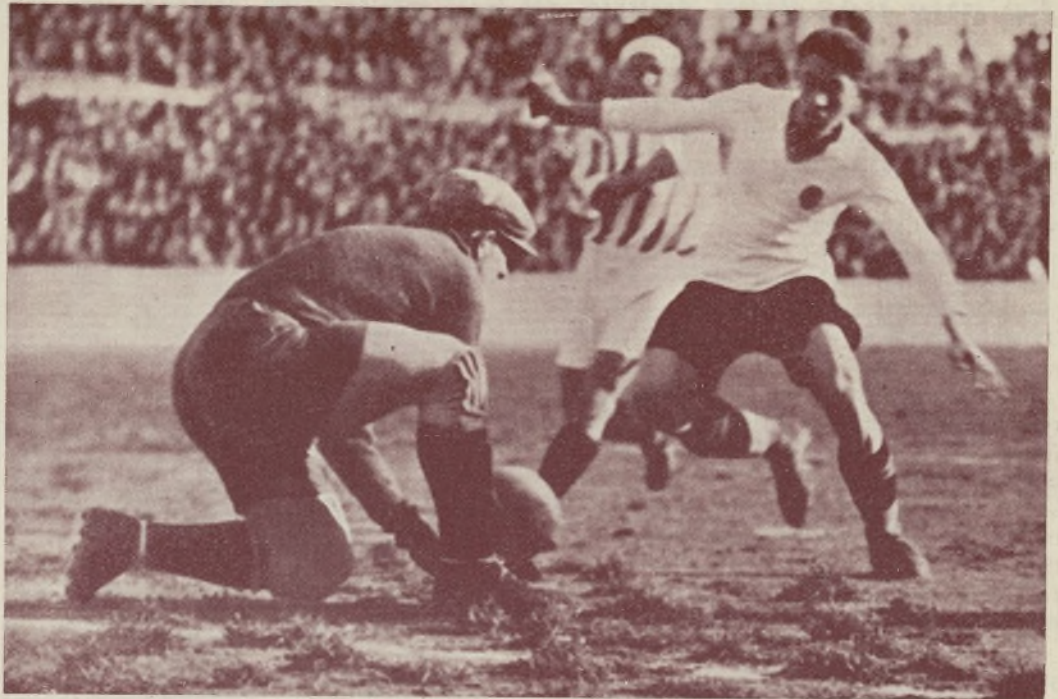
VALENCIA-R. BETIS.—Vilunova en un acose al portero del Betis.

La línea delantera es la que cada día va afianzándose más, producto esta efectividad de la cohesión que se observa entre ellos. Unido esto a un entusiasmo que no