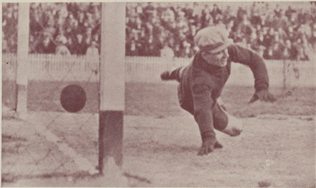
VALENCIA-R. BETIS.—El primer gol conseguido por Costa, de raso y fortísimo tiro.

Francamente, no nos convenció el Betis. Seguramente jugando con un poco más de serenidad desarrollen un mejor fútbol que el de ayer, que no creemos responde a su