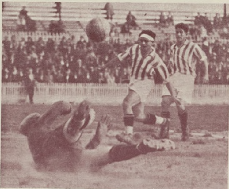
VALENCIA-R. BETIS.—Jesús, difícil y apuradamente, logrará desviar...