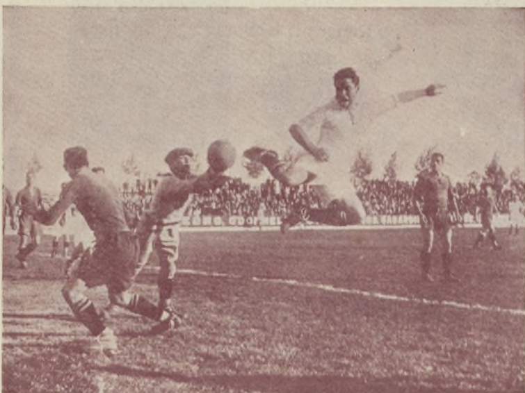
...este género de vida le permite hacer luego estos malabarismos y acrobacias que le reputan el mejor delantero centro nacional.