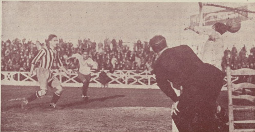
Europa-Athletic.—El primer gol del Europa.