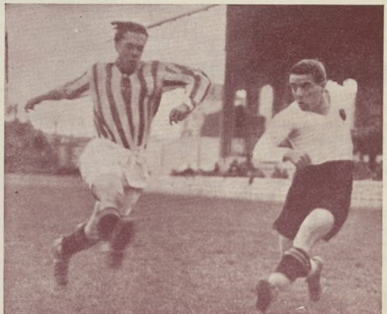
... este formidable tiro cruzado de Sánchez.