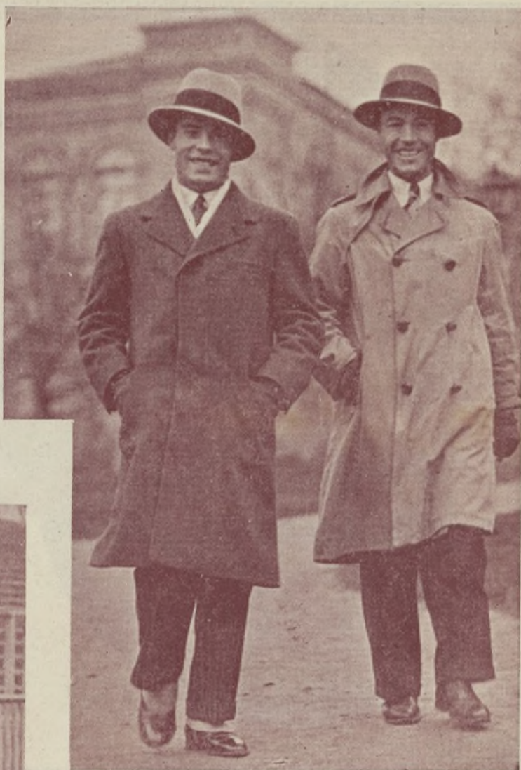
...y antes de almorzar pasea cotidianamente con su hermano por los alrededores de Madrid...