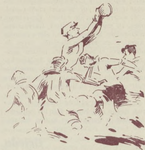
La delantera valenciana acosando a Jesús, que despeja.

te. Algún pase aislado, pero... nada. Nos dicen que aún no está en plena forma después de su enfermedad, pero creemos que con los compañeros de línea que lleva, cuando la recupere, han de ser infructuosas sus excelencias demostradas.