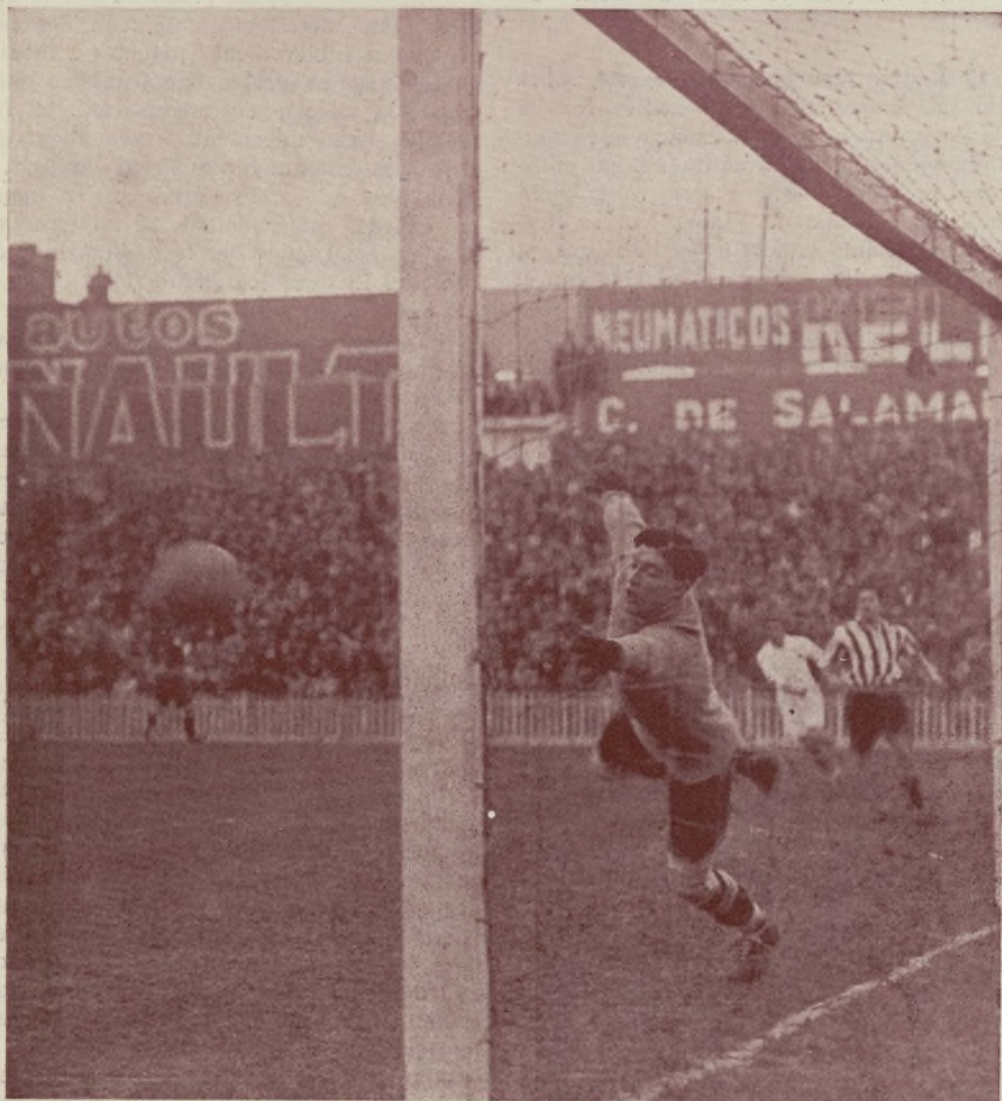
R. Madrid-Athletic de Bilbao. —El primer gol del Madrid.

darse las acciones, se produjo el primer tanto del Madrid. Fué una reacción que inició Galé, y que degeneró en una jugada de Rubio, que envió un excelente pase a Luis Olaso. El centro de éste lo remató Lazcano a media altura fuera del alcance de Blasco.