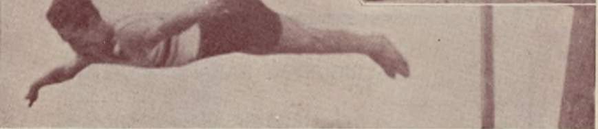
... salta, corre, nada...