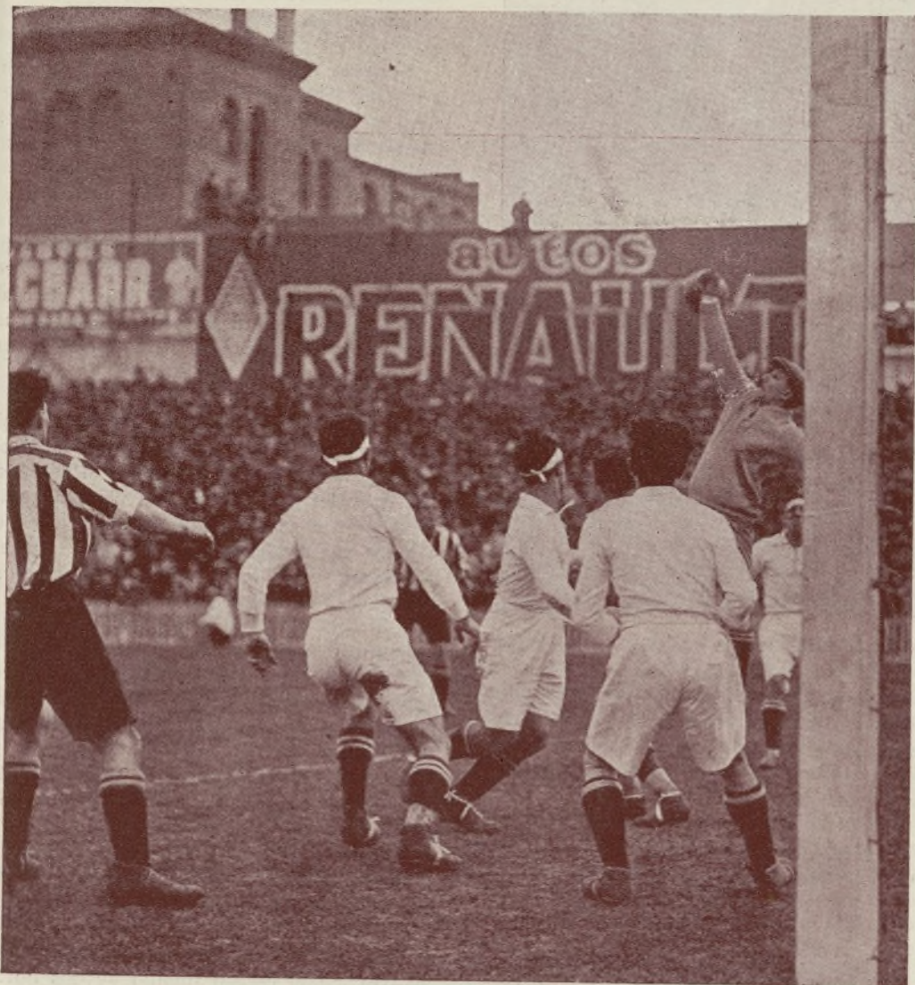
R. Madrid-Athletic de Bilbao.—Un corner contra el Athletic.