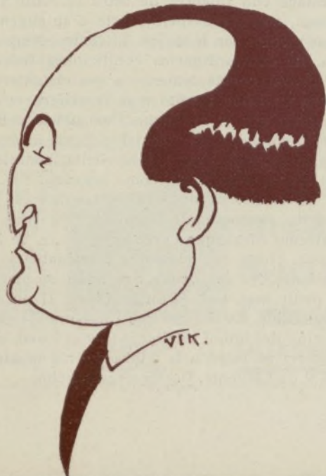
El duque de Estremera, expresidente de la Aero Escuela Estremera y del Aero Club de España.

De momento se destinarán dos de las avionetas llegadas para estas clases y la empresa piensa establecer un servicio de "taxis" aéreo, y organizar manifestaciones deportivas de gran interés.