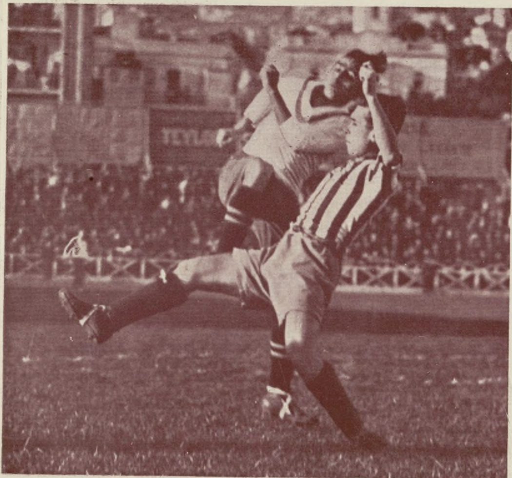
Europa-Athletic III.—Un despeje de la defensa madrileña.