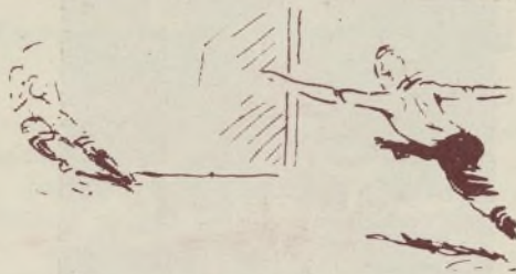
Un chut de Costa.

decae un momento puede llevar al Valencia (de seguir alineando los mismos elementos) bastante lejos en las contiendas que se