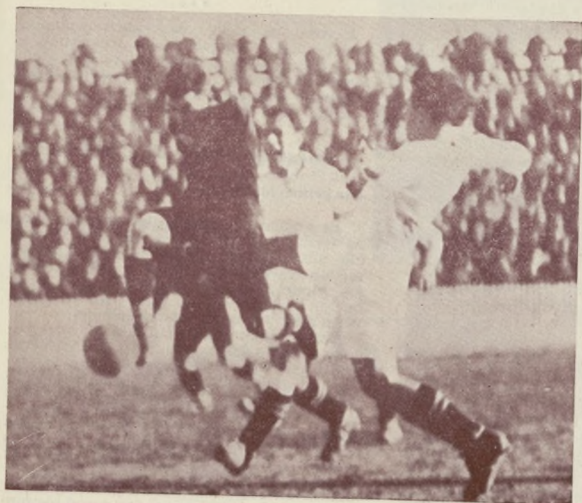
Valencia-Sevilla. — Esta foto nos refleja la dureza con que se jugó el partido y la valentía que derrochó la delantera valenciana.