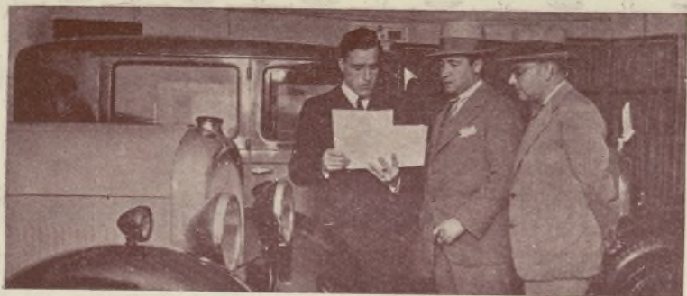
Hasta la hora de comer dedica sus actividades a la ardua tarea de convencer a la gente de que no se debe ir a pie, y de que su marca de automóviles es la mejor.