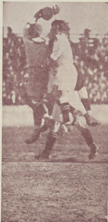
Valencia-Sevilla.—El peligro de la delantera valenciana trajo como consecuencia en ocasiones una defensa del marco sevillano bastante violenta.

...que tuvo una actuación deficiente. No se compenetró con delanteros ni defensas, y esta falta de inteligencia,