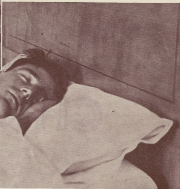
Once de la noche. Su sueño reparador y placido es el final de todos los días de este jugador. Quizá este sueño lo endulsa la imagen, el recuerdo de sus tardes de triunfo, que son todas en las que actúa tan excelente jugador de fútbol