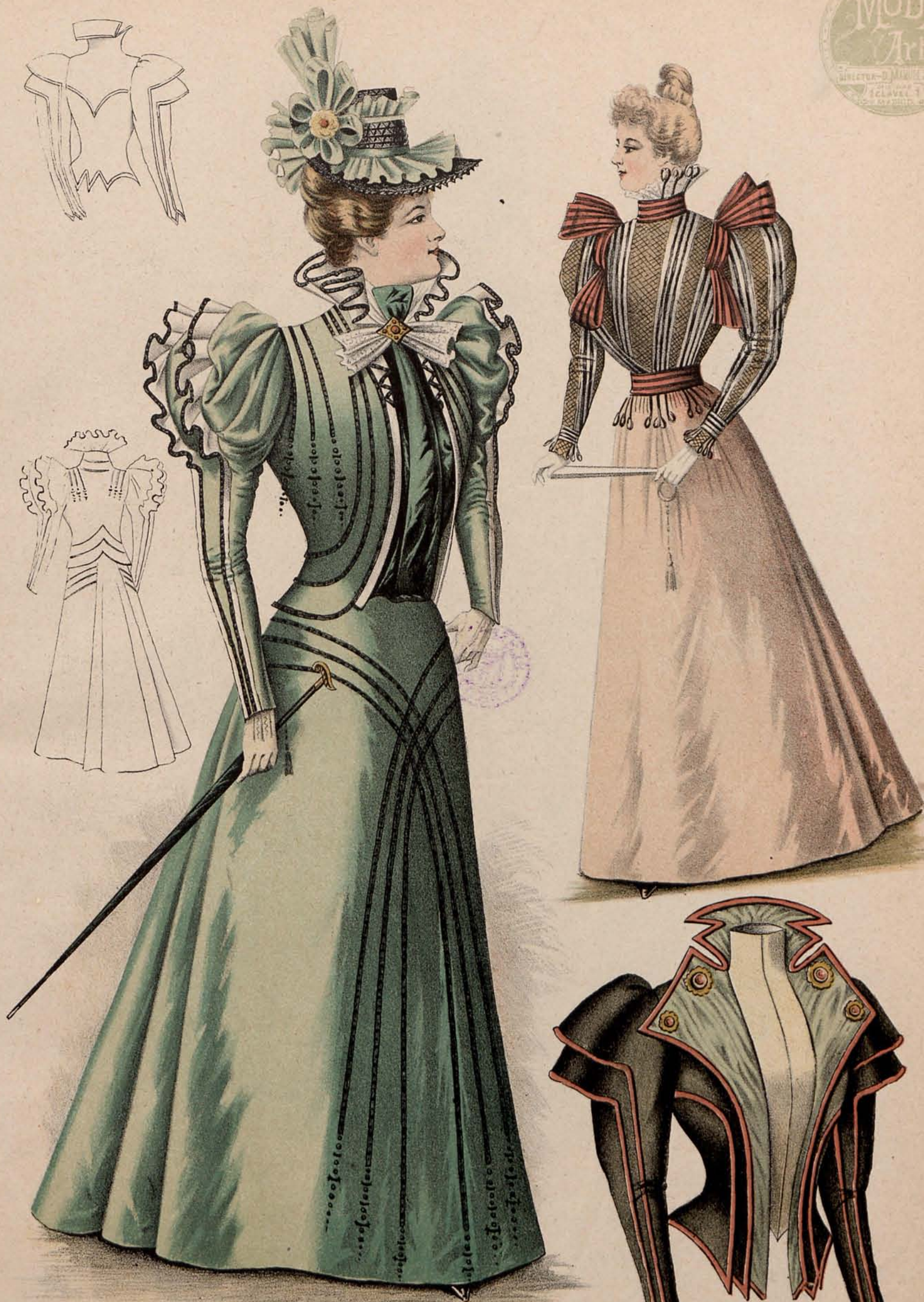
Figura 1. a Traje de paseo.—En paño azul pálido. La falda, que es plana, se adorna de galones de azabache negros, teniendo su nacimiento bajo el doble pliegue de atrás y cruzándose delante cayendo hasta el bajo de la falda. La chaquetita corta, repitiendo el adorno de la falda, es abierta sobre una camiseta-blusa en crepón de la China cielo. Ouello y volantes de las mangas en raso marfil bordeados de galón negro; el cuello continúa por los bordes del delantero y figura un chaleco. Corbata de encaje blanco fijada por una hebilla de bisutería. Sombrero de cadenillas negras, rodeado de volantes de muselina azul cielo y rosetas de cinta de igual tono con fondo de terciopelo amarillo. (Véase reverso.)