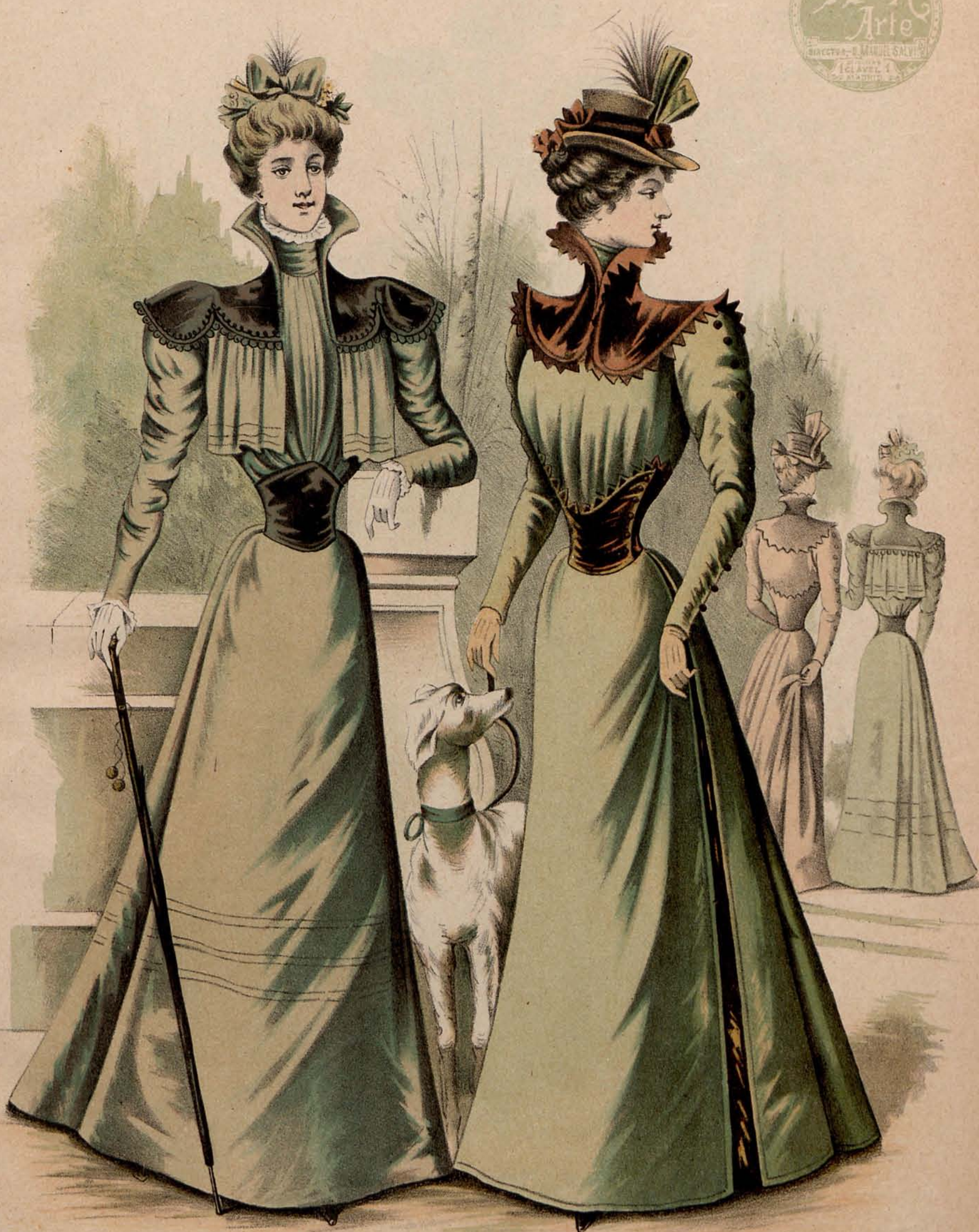
Figura 1. a Traje de visita.—En paño y terciopelo violina. Falda redonda adornada de pespuntos y montada en frunces atrás. Cuerpo-blusa fruncido delante y en la espalda dentro de una cintura de terciopelo. Cuello drapado con ruche. El cuerpo cubierto con un pequeño figaro fruncido bajo un canesú de terciopelo adornado de pasamanería. Mangas fruncidas, terminadas por volante de encaje. Cuello Médicis en paño y terciopelo. Capota de terciopelo adornada de cucús amarillos.