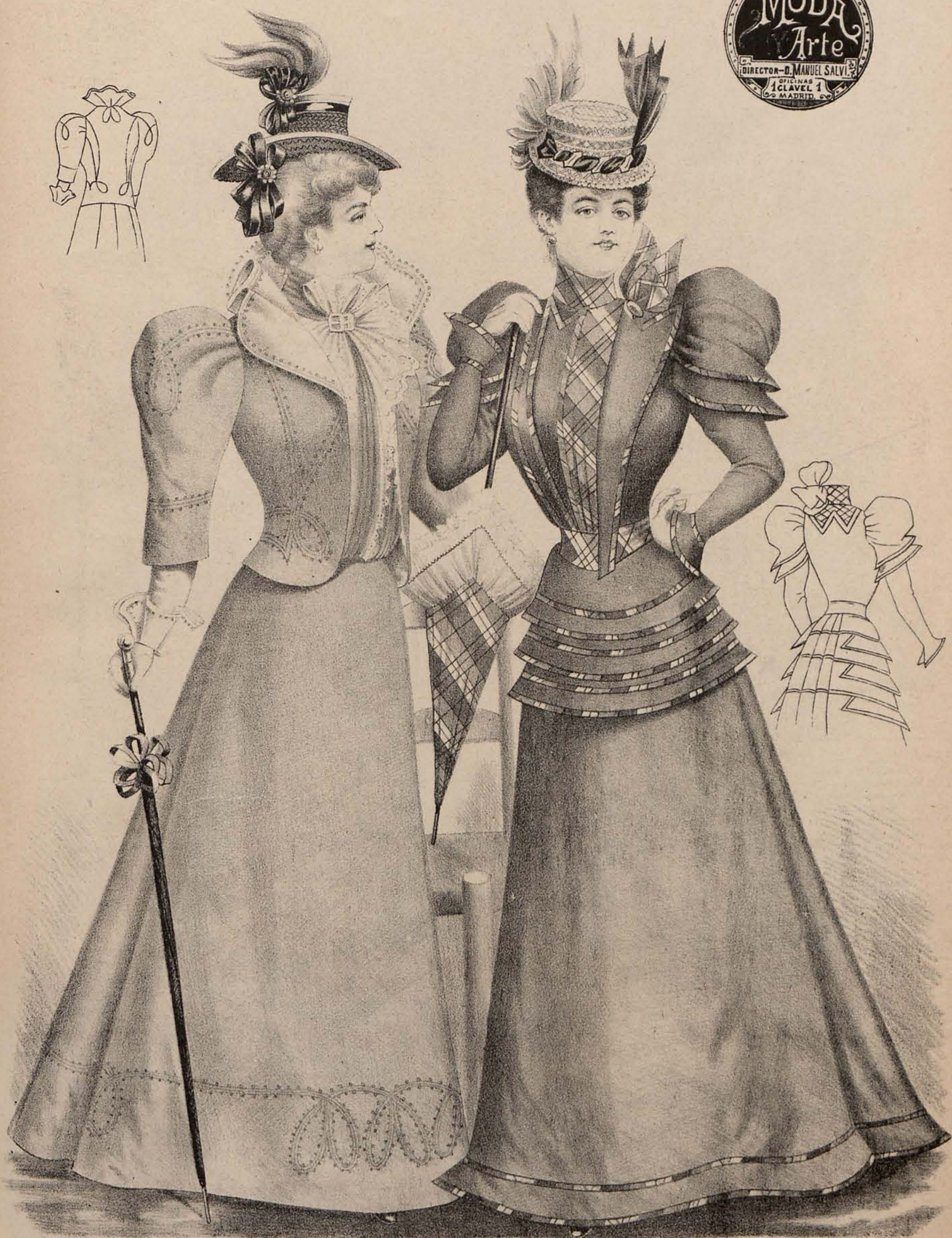
Figura 1.ª Traje de paseo estilo inglés para señoritas.