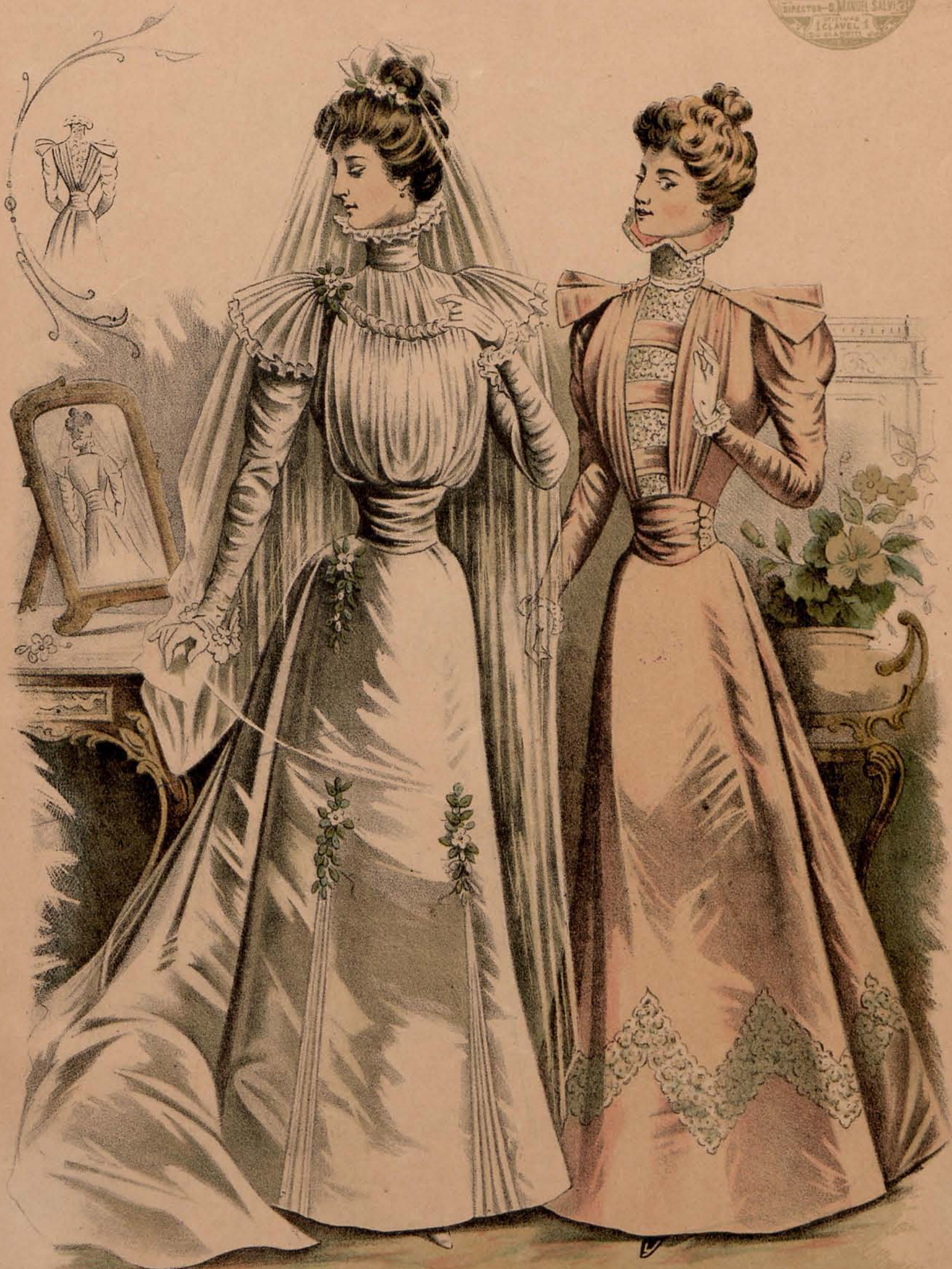
Figura 1. a Traje de desposada.—En paño de seda blanco. Falda neugada con larga cola y ligeramente abierta en los costados del delantal, dejando ver unas pequeñas quillas plisadas terminadas por flores de azahar. Cuerpo blusa escotado, fruncido y sujeto por un ancho cinturón de faya blanca. Camiseta plegada de gasa de seda blanca con cuello alto drapado y larga ruche. Hombros plisados y sobre los hombros ramos de flor de azahar, así como sobre la cadera derecha y en el bajo de las mangas. Gran velo de gasa de seda; flores de azahar en el peinado.