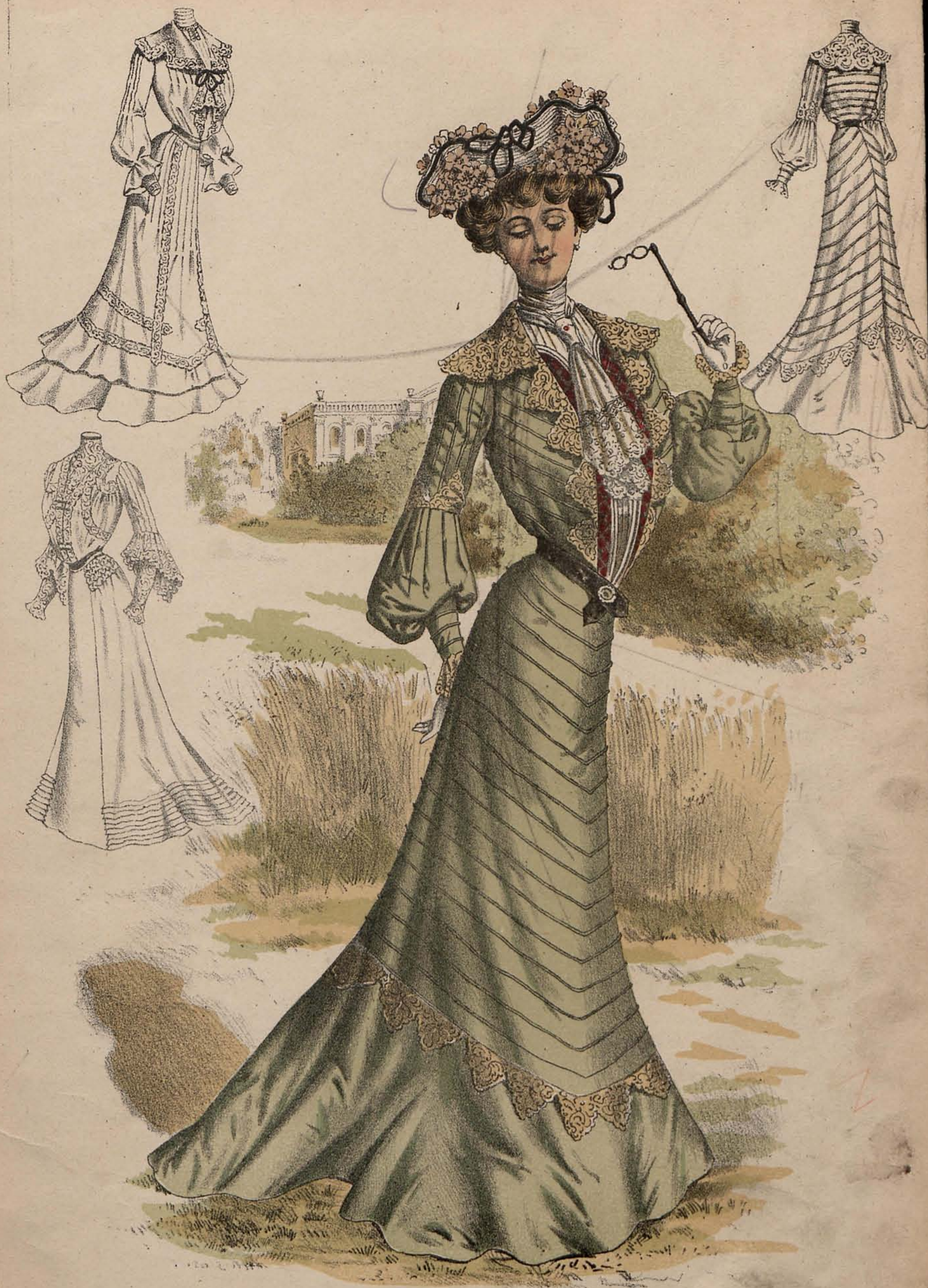
FIGURIN ACUARELA DE LA ÚLTIMA MODA