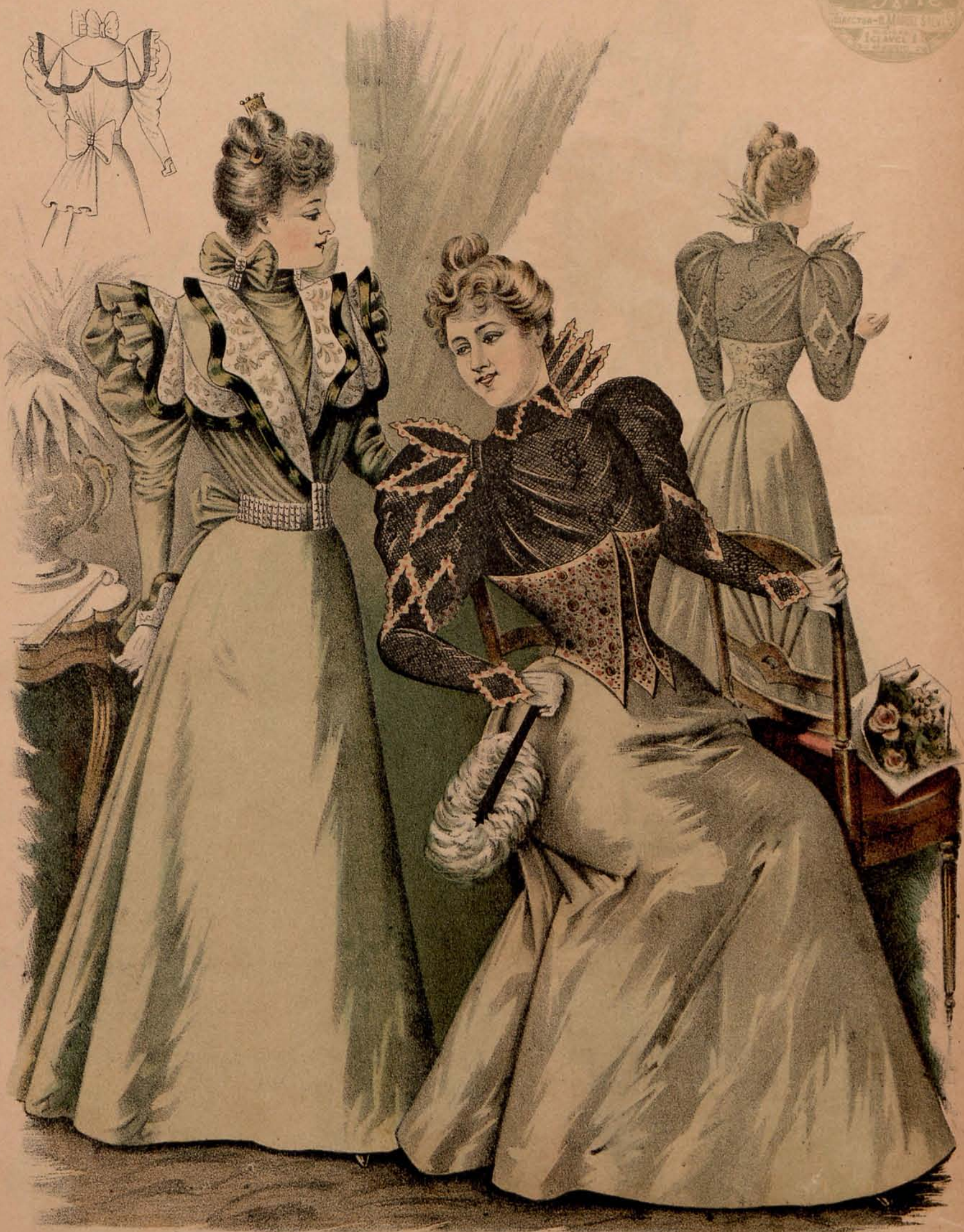
Figura 1. a Traje de ceremonia.—Falda lisa de tafetán tornasolado verde agua. Cuerpo igual adornado de una magnífica broderie de seda en raso blanco, formando reversos cruzados y pequeño bolero; bajo éste una blusa plegada de muselina de seda del mismo tono verde, recogida en la cintura por un cinturón de metal cerrado atrás por una enorme lazada de muselina. Plastrón drapeado de muselina adornado en los costados del cuello por lazadas cogidas por hebillas como el cinturón. (Véase reverso de esta figura.)