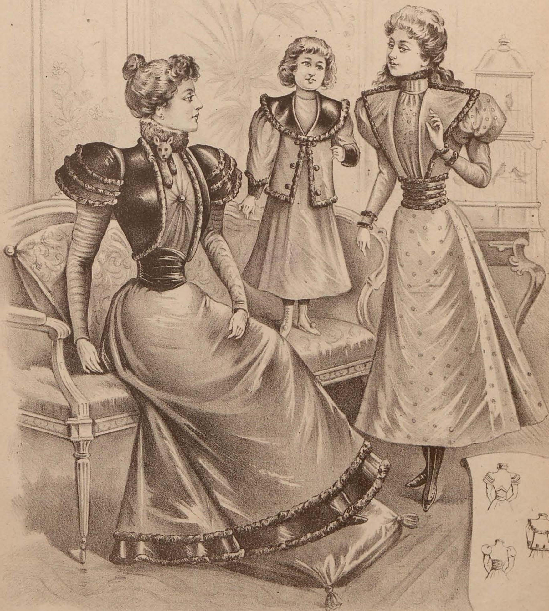
Figura 1. a Traje de visita para señora.—En paño y terciopelo, bordada la banda del bajo de la falda de piel caracul. Cuerpo drapeado, recogido en el centro por un botón fantasía. Corselete-cintura de terciopelo. Chaquetita figaro bordeada de piel; tres dobles jockeys forman en lo alto el bullón de las mangas; éstas son pegadas completamente al brazo. En el cuello, collar de piel con cabeza y patitas naturales.

Fig. 2. a Traje para niña de tres á cinco años.—Vestido negado desde arriba, anejo en el cuello que es alto, liso. Gabán saco, ligeramente abierto, bordeado de piel, con gran cuello redondo de terciopelo y franja de piel. Mangas de bullón con puños de terciopelo bordados de piel.