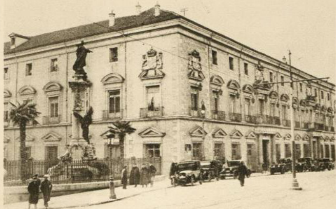
PALACIO DE LOS CONSEJOS (Madrid)

Al final de la calle Mayor se levanta este palacio que en el siglo XVII mandó edificar para su vivienda el privado de Felipe III, D. Cristóbal Gómez de Sandoval, duque de Uceda. Es un edificio enorme, de buenas proporciones y severas líneas, trazado por Francisco de Herrera y terminado por D. Juan Gómez de Mora. Ocupa el lugar de la antigua casa de los Porras y Bozmediano, en la que hubo de estar alojado Carlos I, y es una construcción de notable belleza, a pesar de que hablando de ella y del duque de Uceda dijese Quevedo que era distraimiento de su hacienda y descrédito de su gusto. Sirvió de residencia a la Reina Doña Ana María de Austria, viuda de Felipe IV y madre de Carlos II, la cual murió allí el 16 de mayo de 1696.