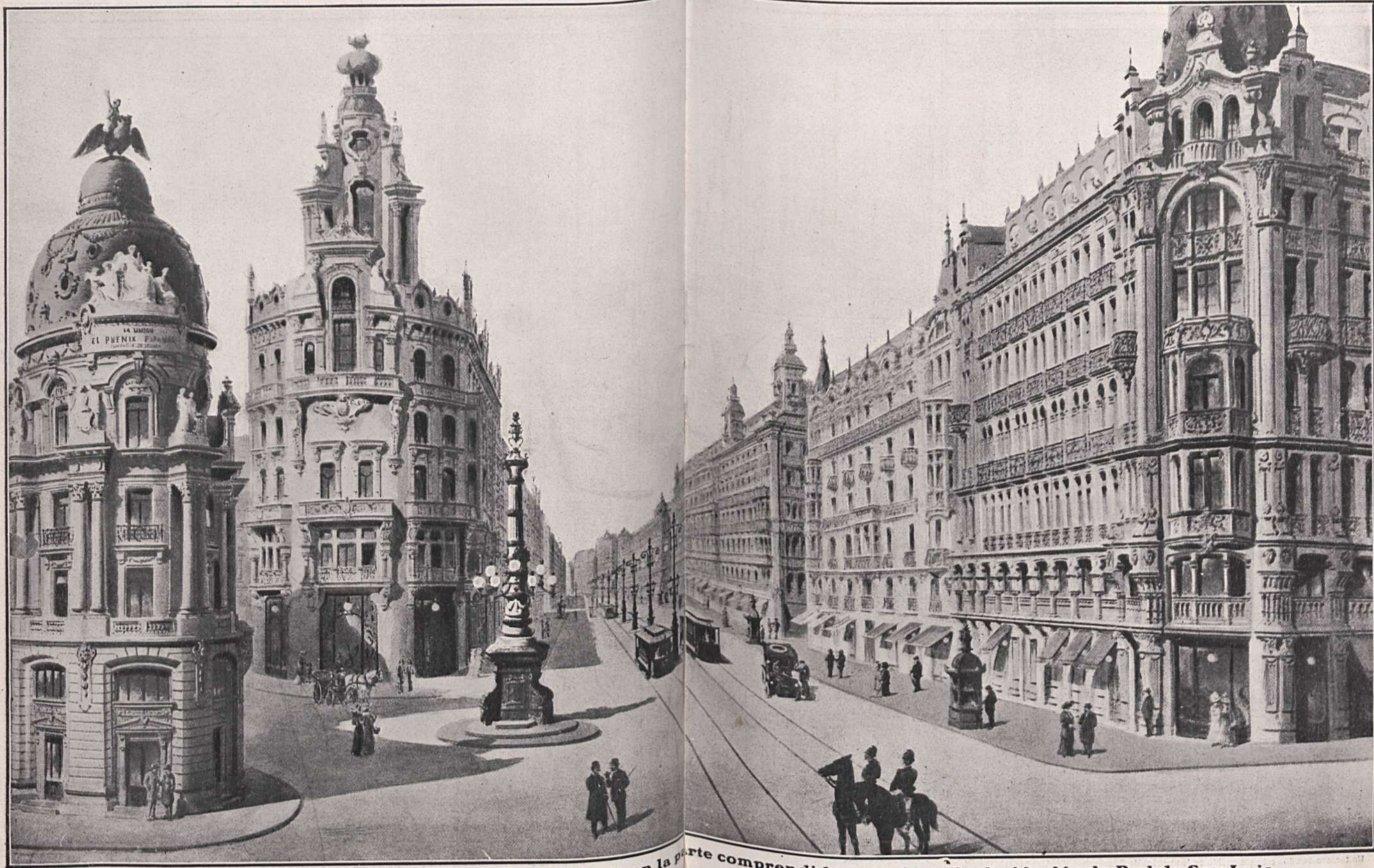
Dibujo del proyecto del primer trozo de la Avenida en la parte comprendida entre la calle de Alcalá y la Red de San Luis