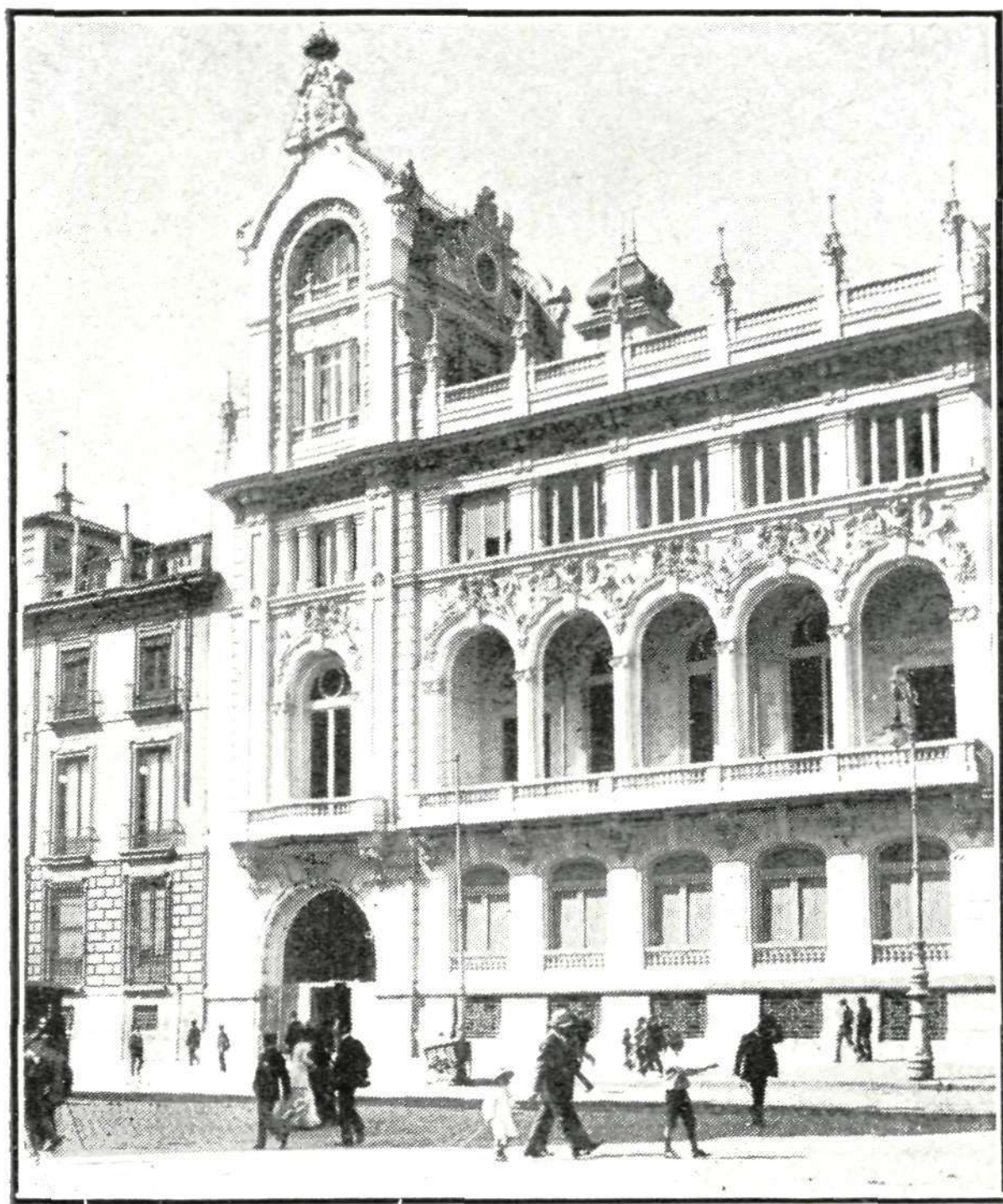
Fachada principal del nuevo edificio del Casino

DESDE hace una semana, el jueves último, inauguró el Casino de Madrid su nueva casa, ese magnífico y suntuoso palacio que todos los vecinos de esta corte han visto construir en la calle de Alcalá. No se han omitido detalles en la construcción del edificio, ni para el adorno, decorado y mueblaje del interior se han escatimado gastos. Todo el confort y la higiene de las construcciones modernas se han llevado al Casino, que alterna las comodidades de sus socios con la participación que toma en sin fin de obras benéficas á las cuales contribuye espléndidamente la referida sociedad.