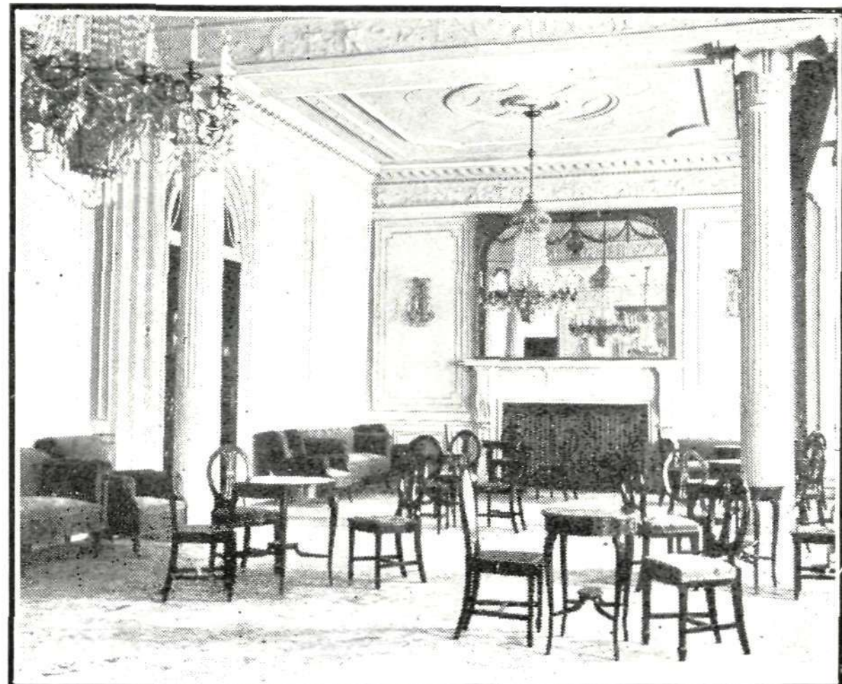
Salón del piso bajo, cuyos muebles, lámparas y apliques han sido hechos por la casa Suárez