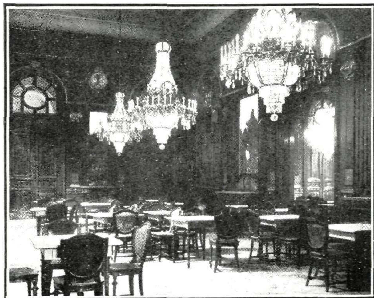
Comedor de socios del Casino, cuyo decorado, muebles y apliques han sido hechos por la casa Suárez

La inauguración de la nueva casa del Casino ha constituido un suceso madrileño, interesantísimo por la parte activa y generosa que esta aristocrática sociedad toma en cuanto puede contribuir al esplendor de la corte y al beneficio de la población, por cuya razón creemos satisfacer la curiosidad general publicando la información de la presente plana.