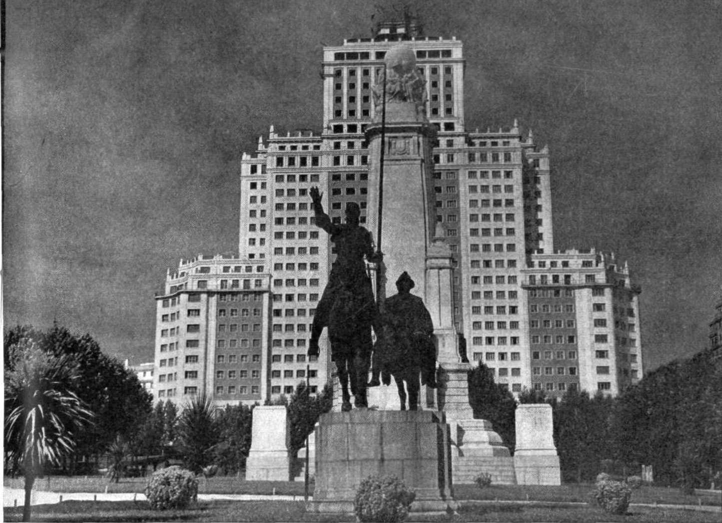
El monumento a Cervantes se perfila sobre el conjunto de la construcción. Don Quijote, gran adelantado de España, da la bienvenida al viajero que llega por la cuesta de San Vicente y que contempla el contraste entre nuestras viejas glorias perdurables y el moderno alarde de unos artistas de hoy.